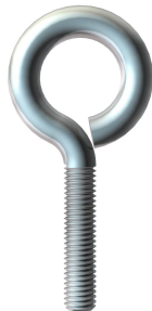
Œillet de châssis M8 x 40 mm