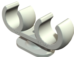
Collier de serrage sur socle 2 câbles 18-22 mm