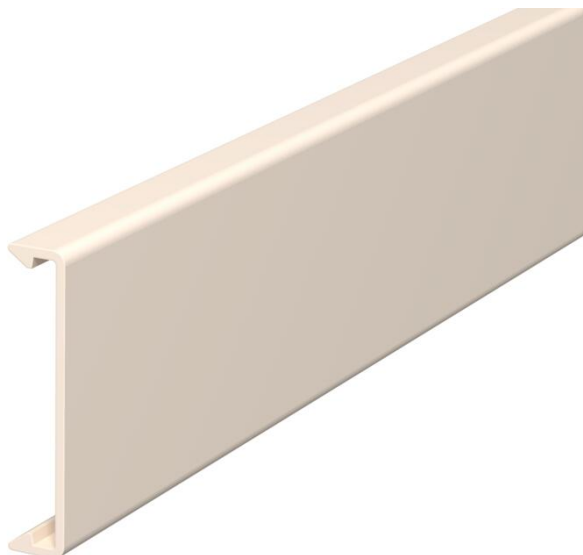
Couvercle pour l'obturation des goulottes.